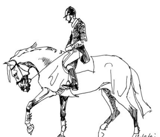
obniżone, głębokie i zaokrąglone